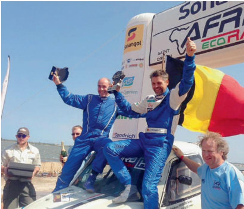
Le podium final de cette Africa Eco Race 2014 était couvert de noir, de jaune et de rouge...