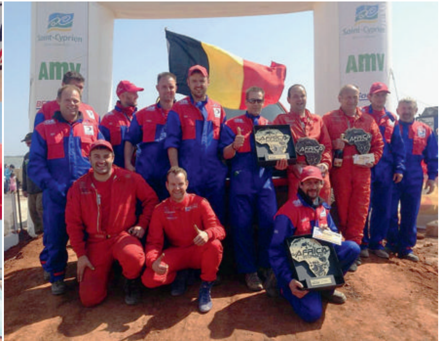
Le podium final de cette Africa Eco Race 2014 était couvert de noir, de jaune et de rouge...