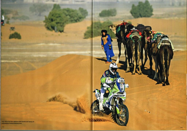
Beim Abuja Six Race gehören viele Kamelle und Tierer zu authentischer Wüstenschauung