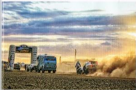
Auch beim Africa Eco Race gehen Race-Trucks, phantasievolle Buggys und kerelige Allradler an den Start. Die Motorräder gehen über gemessene Dünne