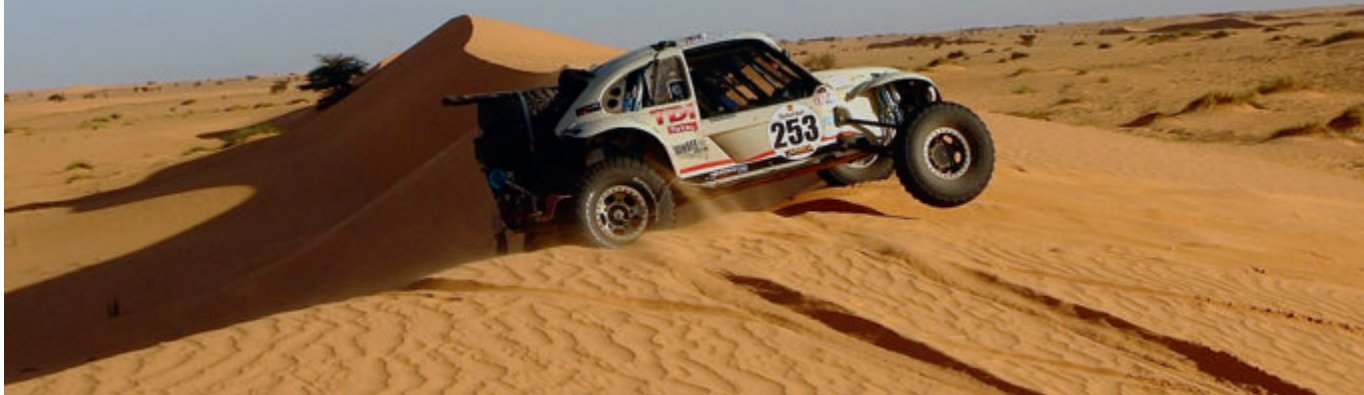
► Rudy Goeminne et Erwin Imschoot ont passé du temps dans les dunes mauritaniennes...